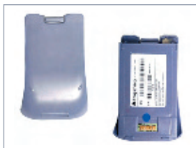
Leistungsstarker Li-Ion Akku

Uneingeschränkte Mobilität in allen deutschen Mobilfunknetzen