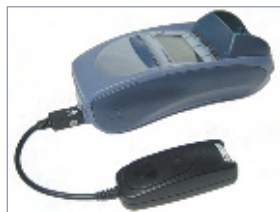
Back-Up Modem und RS232 Schnittstelle